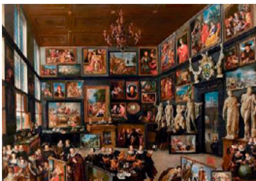
La galerie de Cornelis van der Geest - Willem van Haecht, 1628