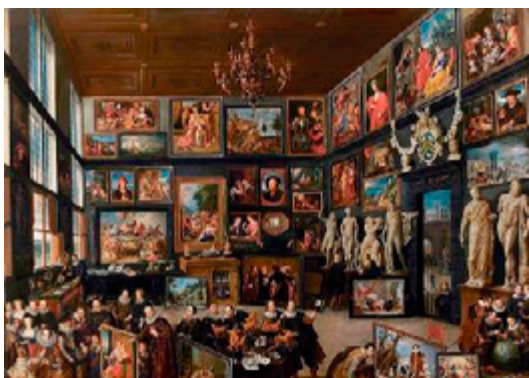
La galerie de Cornelis van der Geest - Willem van Haecht, 1628