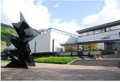
Musée de Grenoble