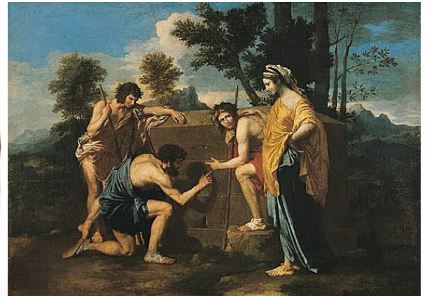
Nicolas Poussin, Les Bergers