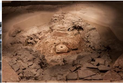
Cuve baptismale Crypte de la cathédrale de Grenoble