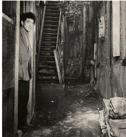
Brassaï Giacometti à la porte de son atelier 14e arrd_1948_coll Centre Pompidou

Dans l'atelier. L'artiste photographié d'Ingres à Jeff Koons , Exposition, Paris, Petit-Palais, 5 avril-17 juillet 2016.