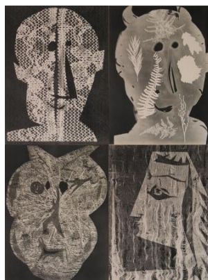
Découpage des héliogravures du photographe André Villers par Picasso pour l'album Diurnes (Bergruen, 1962)

Lucie GOUJARD, « L'art en prétexte. Naissance de l'édition moderne », in Revue de la Bibliothèque nationale de France , n°44, Paris, Bnf, numéro consacré à l'histoire du livre de photographie, Marie-Claire Saint-Germier (dir.), octobre 2013.