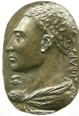
L. B Alberti (1404-1472)