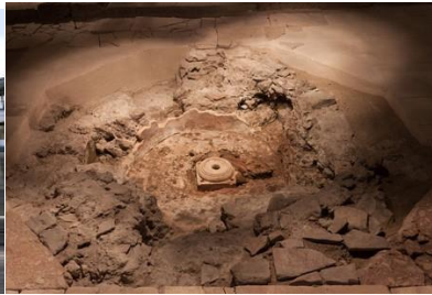
Cuve baptismale Crypte de la cathédrale de Grenoble