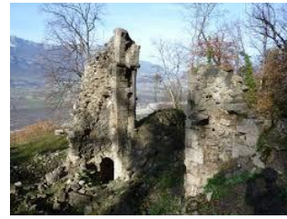
Prieuré bénédictin de Saint—Michel de Connexe

Cette formation dispense des outils à la fois théoriques et pratiques reposant sur trois axes complémentaires