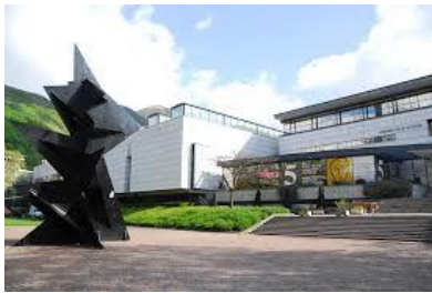
Musée de Grenoble