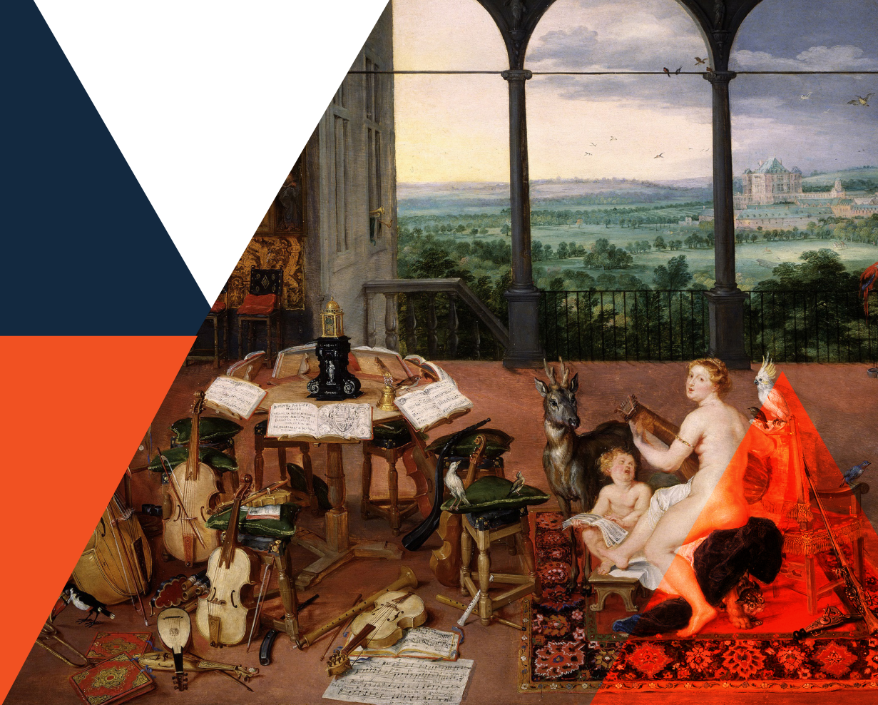
Jan Brueghel l'Ancien, Peter Paul Rubens, Allégorie de l'ouïe , 1617-1618.