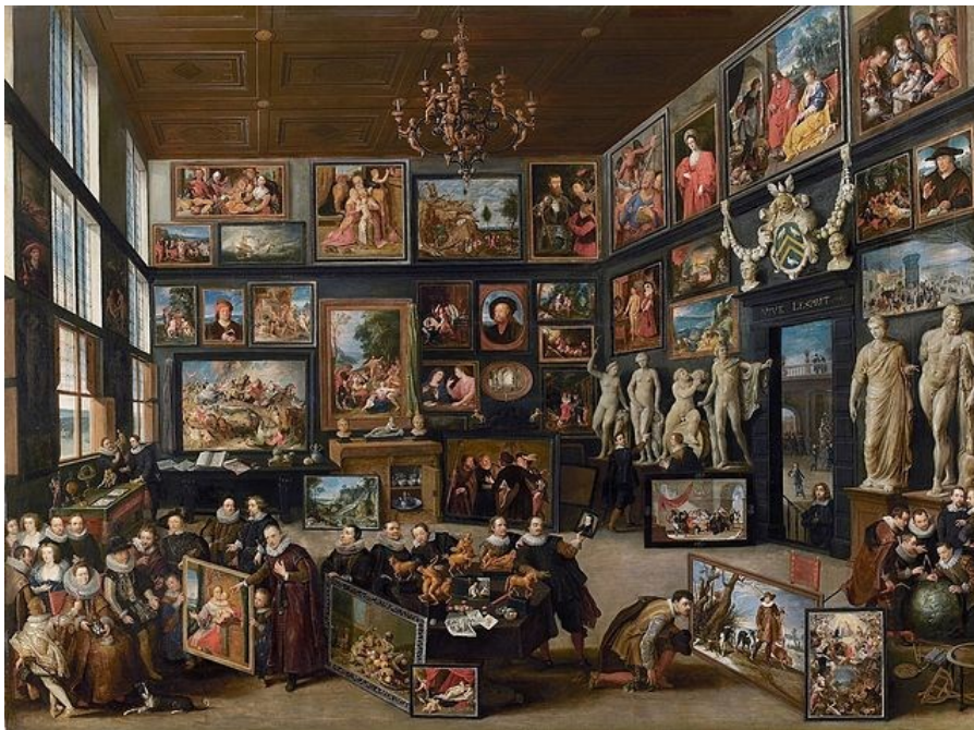
La galerie de Cornelis van der Geest - Willem van Haecht, 1628