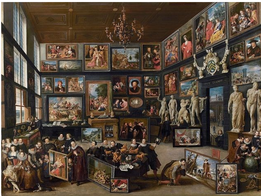
La galerie de Cornelis van der Geest - Willem van Haecht, 1628