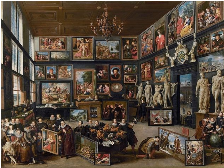
La galerie de Cornelis van der Geest - Willem van Haecht, 1628