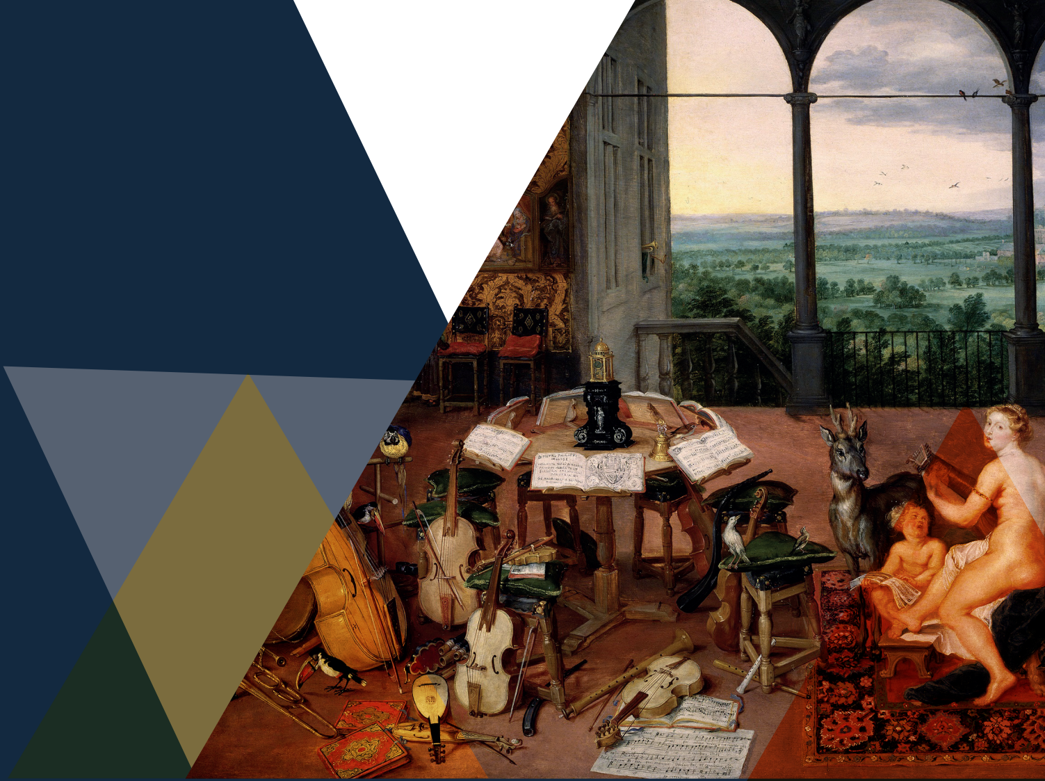
Jan Brueghel l'Ancien, Peter Paul Rubens, Allégorie de l'ouïe , 1617-1618.