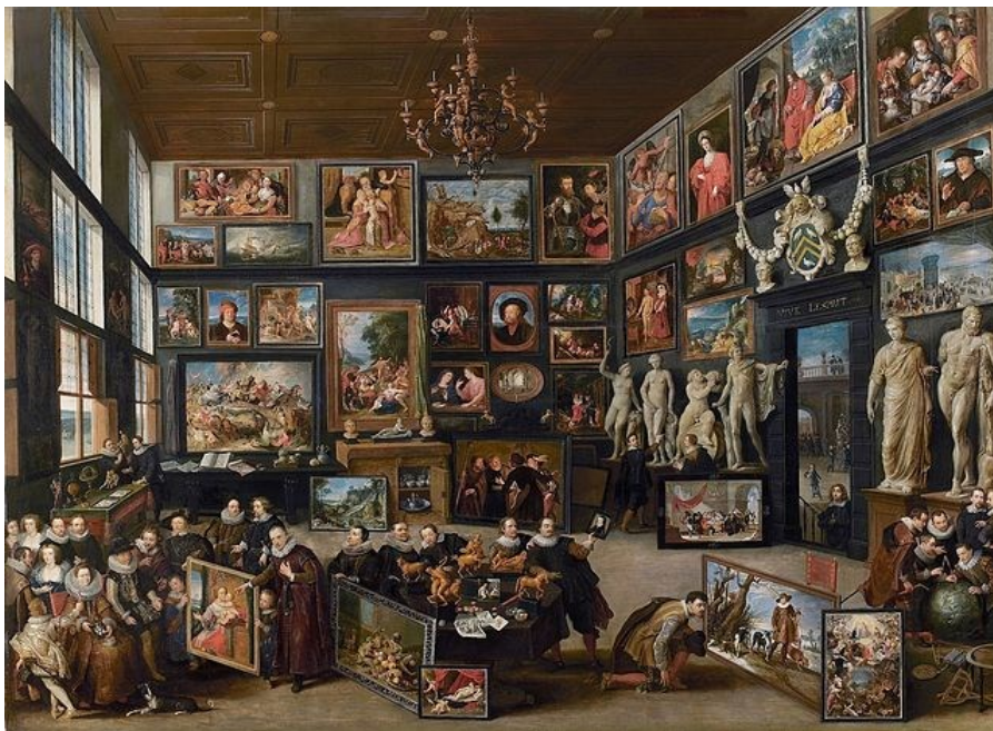
La galerie de Cornelis van der Geest - Willem van Haecht, 1628