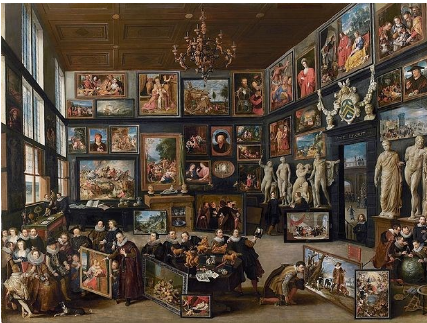
La galerie de Cornelis van der Geest - Willem van Haecht, 1628