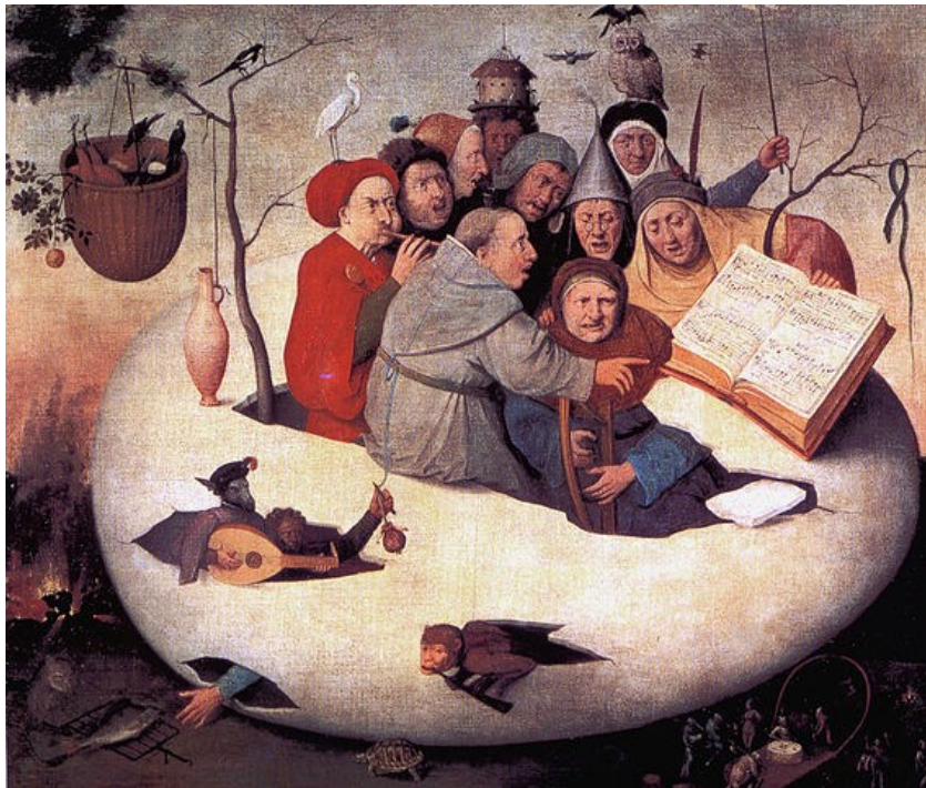
Le concert dans l'œuf - École de Jérôme Bosch, vers 1561