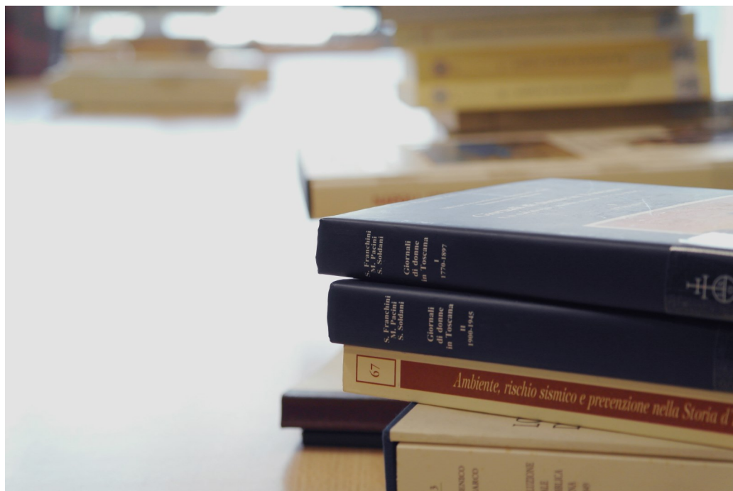
Ouvrages du centre de ressources de l'ARSH